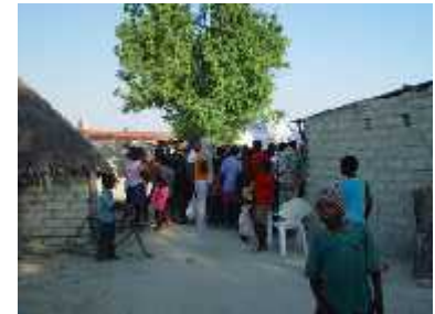
Partnergemeinde Omundungilo.

2002 gab es ein weiteres Workcamp für den Bau eines Gebühthauses mit Teilnahme aus Deutschland. Im Laufe der Partnerschaft veränderten sich Aufgaben und Ziele. Ein Job-Programm zur Förderung von Ausbildung und Beruf für eine nachhaltige Entwicklung im ländlichen Norden Namibias soll bei der Verringerung der Arbeitslo-